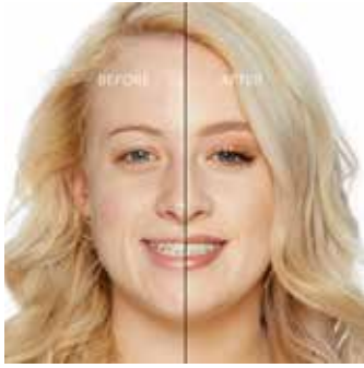
SWAN - Muy Claro con Subtono Neutro