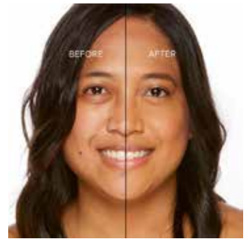
MOCHA - Bronceado con Subtono Rosado