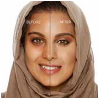
SAND - Medio con Subtono Dorado