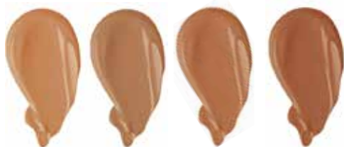
WARM SAND HONEY BUTTERSCOTCH MOCHA