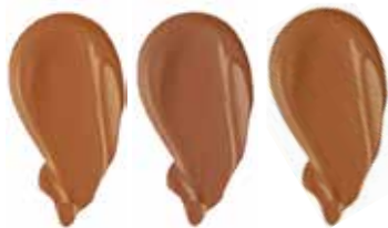
MAPLE CHESTNUT TOFFEE