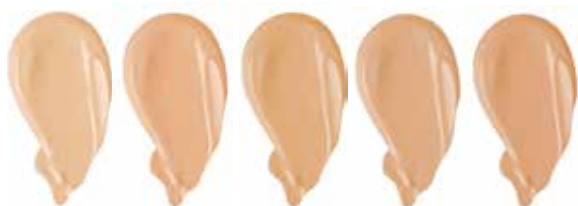
VANILLA NUDE GOLDEN BEIGE LIGHT BEIGE NATURAL BEIGE