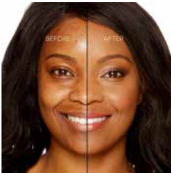
MAPLE - Oscuro con Subtono Rosado