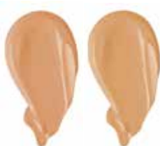
WARM BEIGE SAND