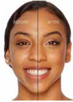
BUTTERSCOTCH - Bronceado con Subtono Neutro