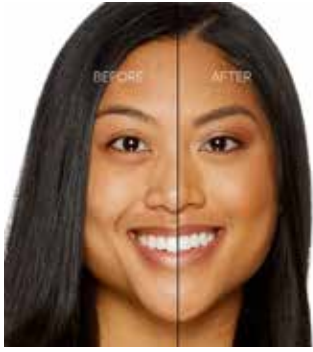
WARM SAND - Bronceado con Subtono Dorado