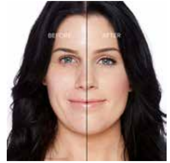
PORCELAIN - Muy Claro con Subtono Neutro