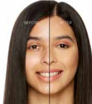
GOLDEN BEIGE - Claro con Subtono Dorado