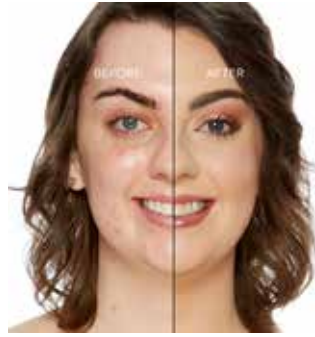
ALMOND - Muy Claro con Subtono Dorado