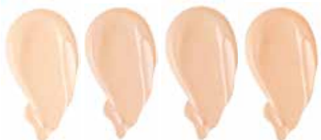
SWAN SNOW ALMOND PORCELAIN