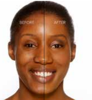
TOFFEE - Oscuro con Subtono Dorado