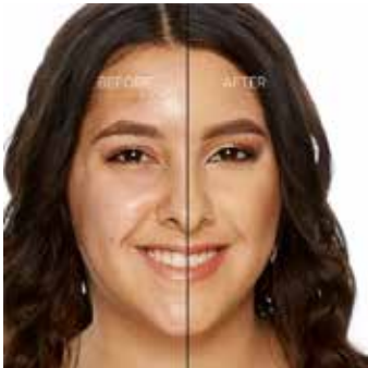
NATURAL BEIGE - Claro/Medio con Subtono Neutro