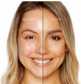
WARM BEIGE - Medio con Subtono Neutro