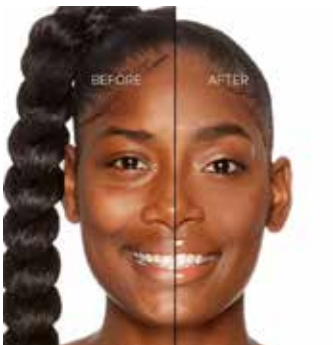
COCOA - Muy Oscuro con Subtono Neutro