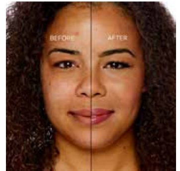
CAMEL - Bronceado con Subtono Neutro