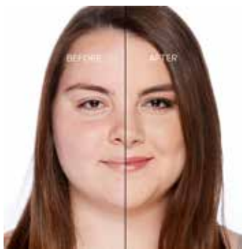
PEARL - Claro con Subtono Neutro