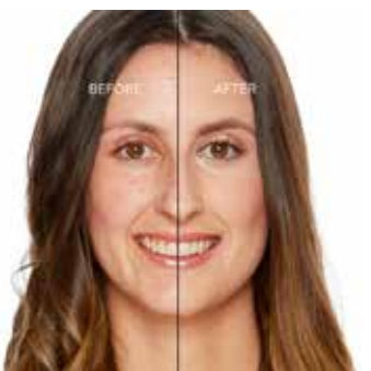
NUDE - Claro con Subtono Rosado