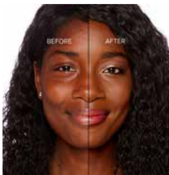
COCOA - Muy Oscuro con Subtono Neutro a Rosado