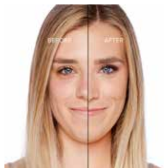
WARM NUDE - Claro con Subtono Neutro a Dorado