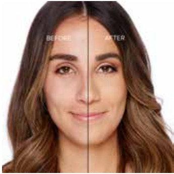
WARM BEIGE - Medio con Subtono Neutro