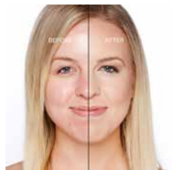
VANILLA - Claro con Subtono Neutro