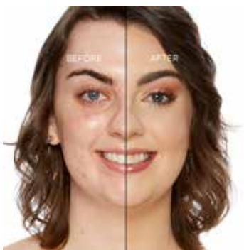
ALMOND - Claro con Subtono Dorado