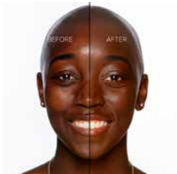
GANACHE - Muy Oscuro con Subtono Neutro