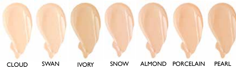
CLOUD SWAN IVORY SNOW ALMOND PORCELAIN PEARL