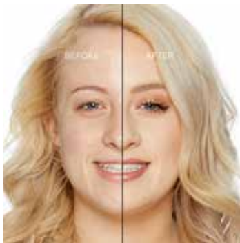
SWAN - Muy Claro con Subtono Neutro