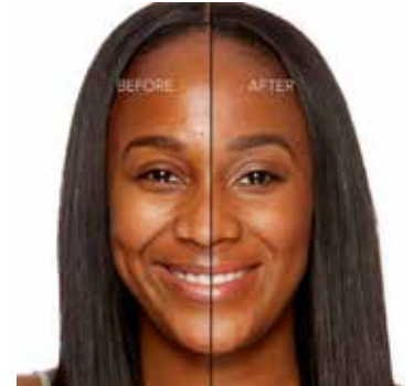
HAZELNUT - Oscuro con Subtono Rosado