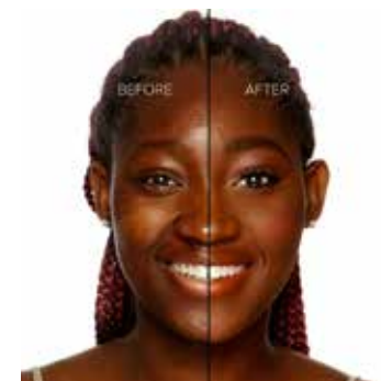
TRUFFLE - Muy Oscuro con Subtono Dorado