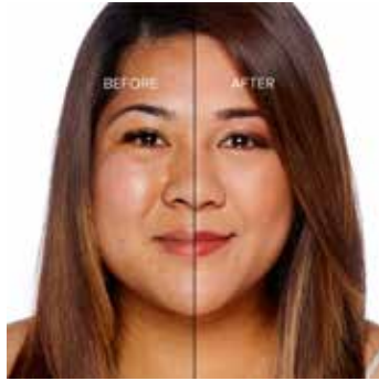
GOLDEN - Medio con Subtono Rosado