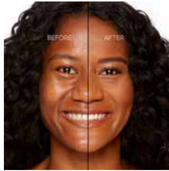
CHAI - Oscuro con Subtono Dorado