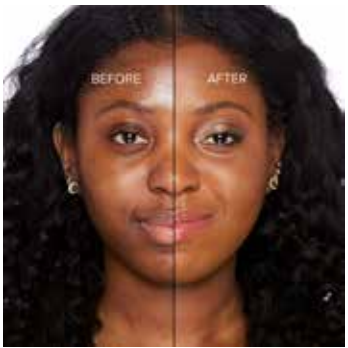
MAHOGANY - Oscuro con Subtono Dorado