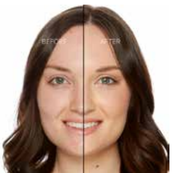
SEASHELL - Claro con Subtono Rosado