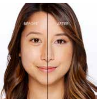
NATURAL BEIGE - Claro/Medio con Subtono Neutro