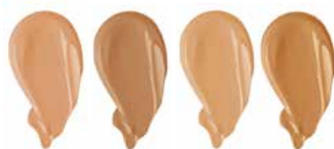
WARM BEIGE GOLDEN SAND PRALINE