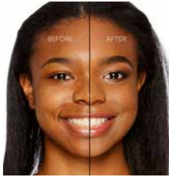
CHESTNUT - Oscuro con Subtono Neutro