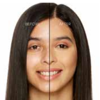
GOLDEN BEIGE - Claro con Subtono Dorado