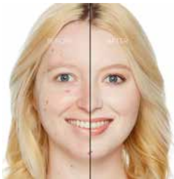
CLOUD - Muy Claro con Subtono Rosado