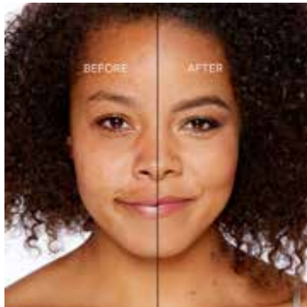
WARM SAND - Bronceado con Subtono Dorado