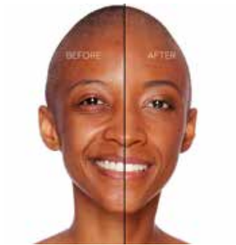
SPICED RUM - Oscuro con Subtono Rosado