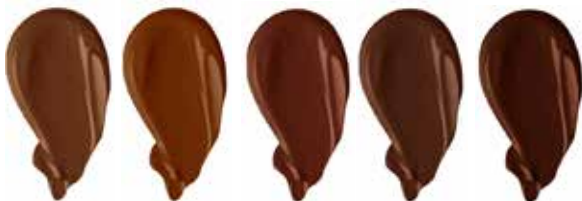
TIRAMISU COCOA SABLE TRUFFLE GANACHE