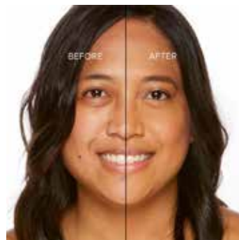
MOCHA - Bronceado con Subtono Rosado