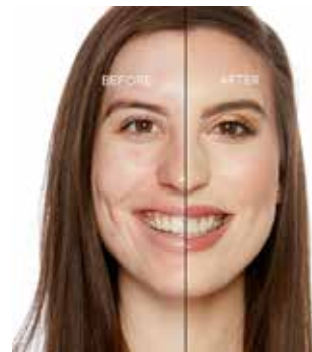
SNOW - Muy Claro con Subtono Neutro a Rosado