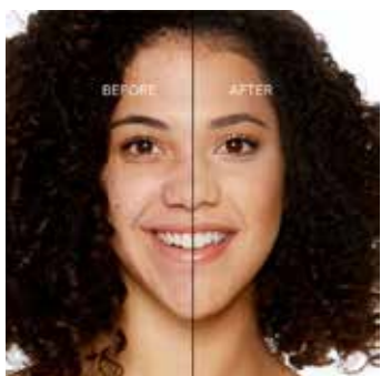
LIGHT BEIGE - Claro con Subtono Neutro a Rosado