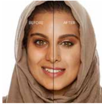
SAND - Medio con Subtono Dorado