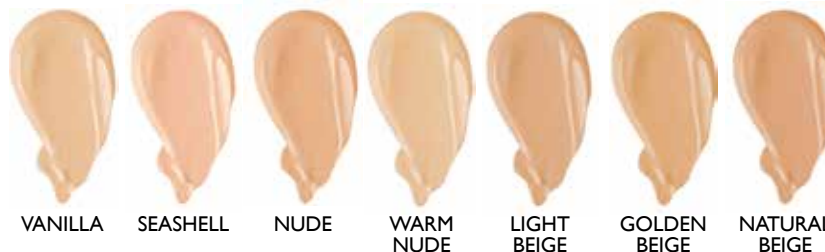
VANILLA SEASHELL NUDE WARM NUDE LIGHT BEIGE GOLDEN BEIGE NATURAL BEIGE