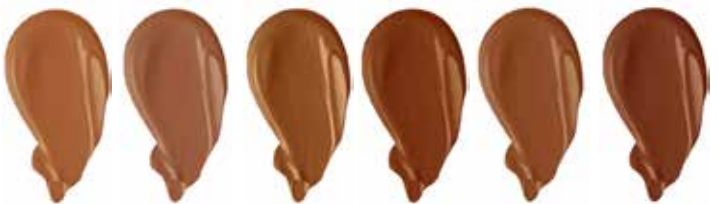
MAPLE CHESTNUT CHAI HAZELNUT MAHOGANY SPICED RUM