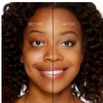
BUTTER PECAN - Bronceado con Subtono Neutro