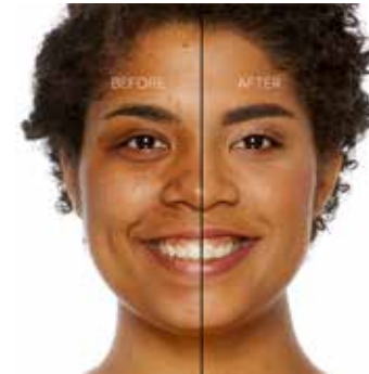
BRULEE - Bronceado con Subtono Dorado