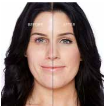
PORCELAIN - Claro con Subtono Neutro