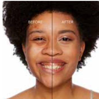
HONEY - Bronceado con Subtono Neutro a Rosado