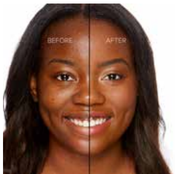
TIRAMISU - Muy Oscuro con Subtono Dorado