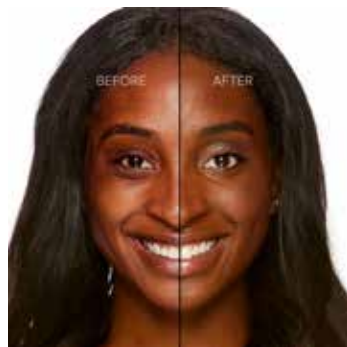
SABLE - Muy Oscuro con Subtono Rosado