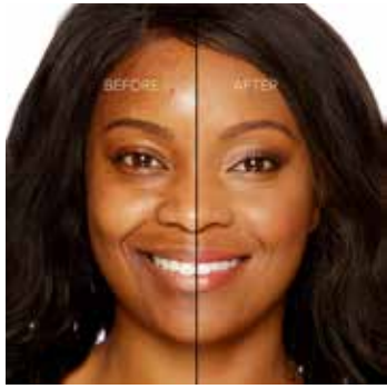
MAPLE - Oscuro con Subtono Rosado