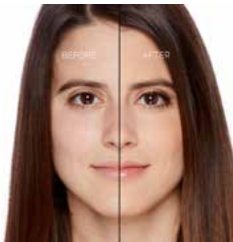
IVORY - Muy Claro con Subtono Dorado